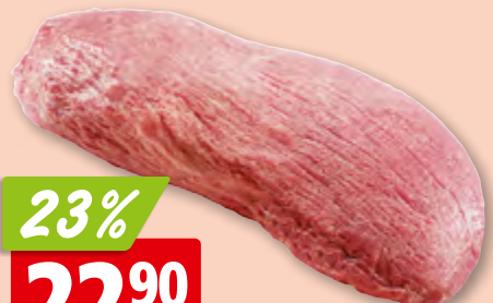
Rinds-Voressen Gastro frisch von der Haxe aus der Schweiz/Deutschland, ca. 3 kg (ungeschnitten: 14.91/kg, 23%)