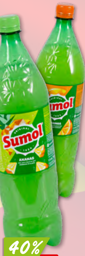
35969 Sumol Orange oder Ananas 4 x 6