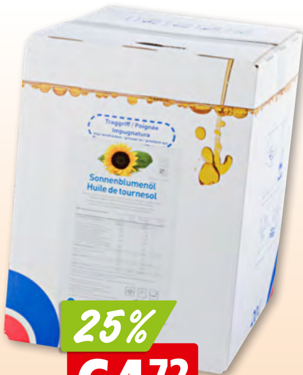
Nutriswiss Sonnenblumenöl High Oleic