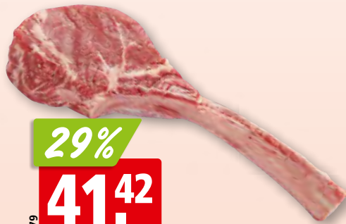
Rinds-Ribeye Black Angus frisch aus Argentinien/Uruguay