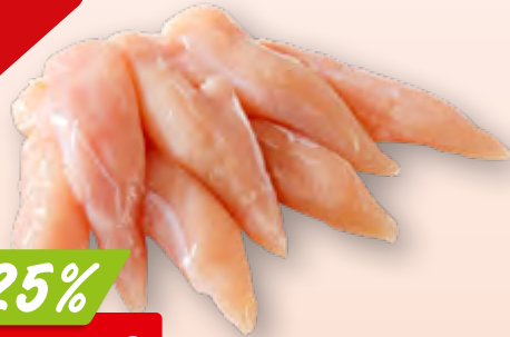
Pouletbrust frisch aus Ungarn, ca. 2.5 kg