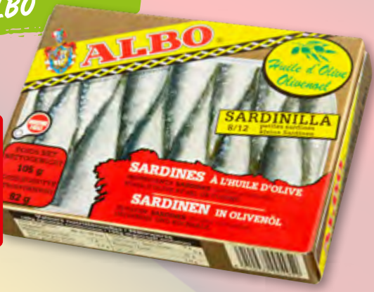
Sardinilla in Olivenöl, 6 x