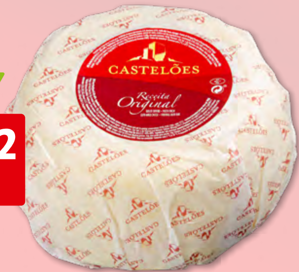
Queijo Castelões ca. 1.3 kg