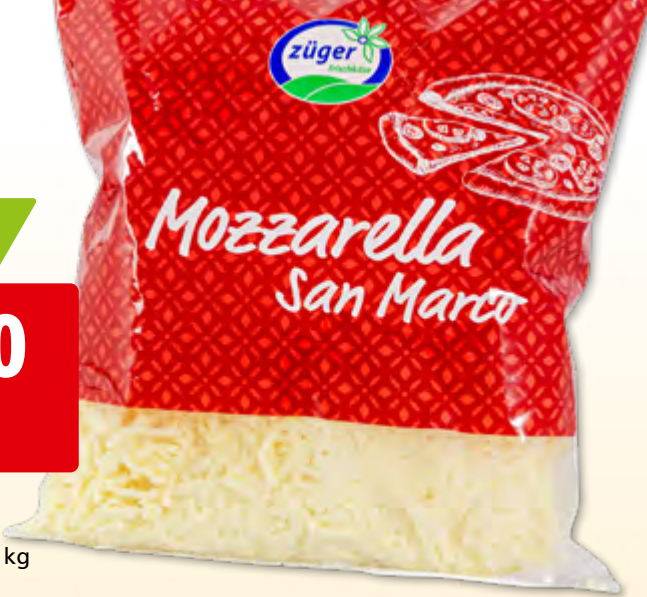
Mozzarella San Marco Züger en julienne, 5 x 2 kg