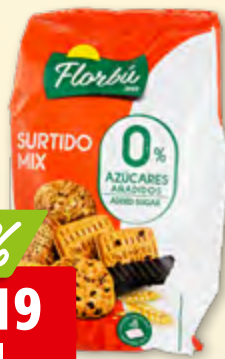
Surtido mix Florbù