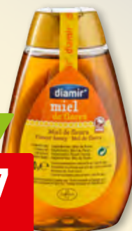
Miel de flores Diamir 12 x