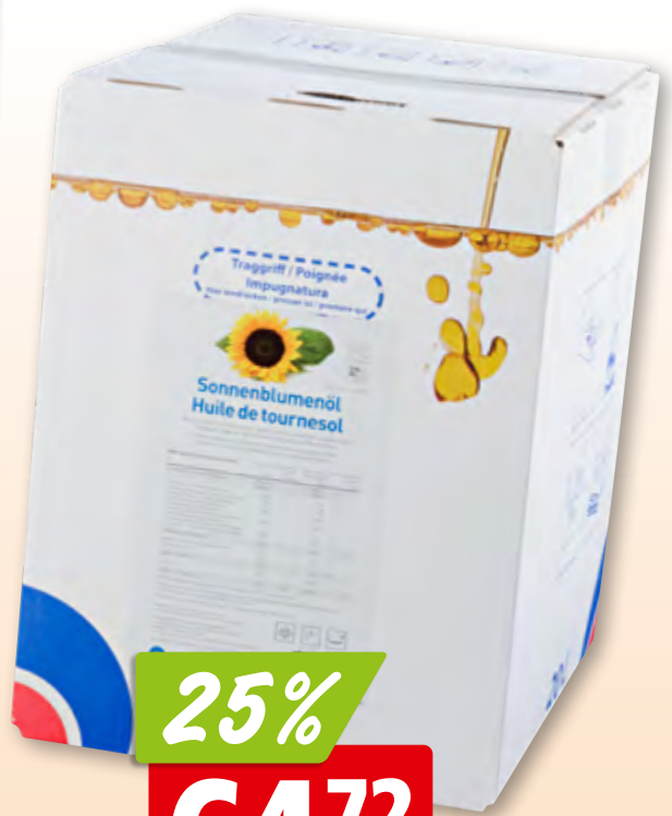
Huile de tournesol High oleic Nutriswiss