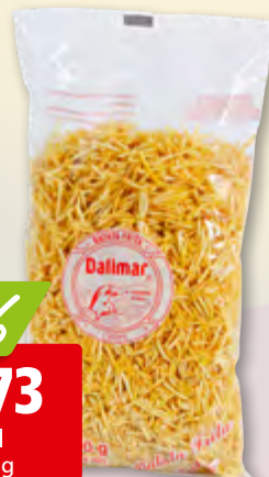
Batata frita Dalimar