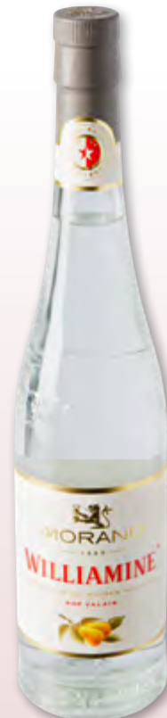
Liqueur Williamine Morand 35% vol., 6 x