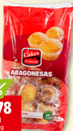
Magdalenas aragonesas Heras