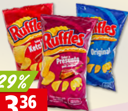
Chips Ruffles original, sabor a presunto ou ketchup 2 x