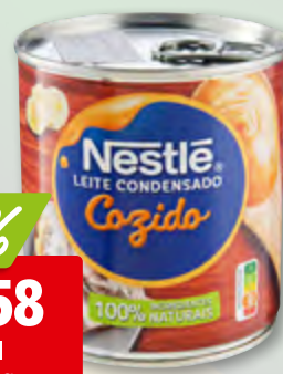
Lait condensé Nestlé cuit