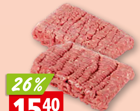
Hamburgers de bœuf Black Angus frais de Suisse, 6 x