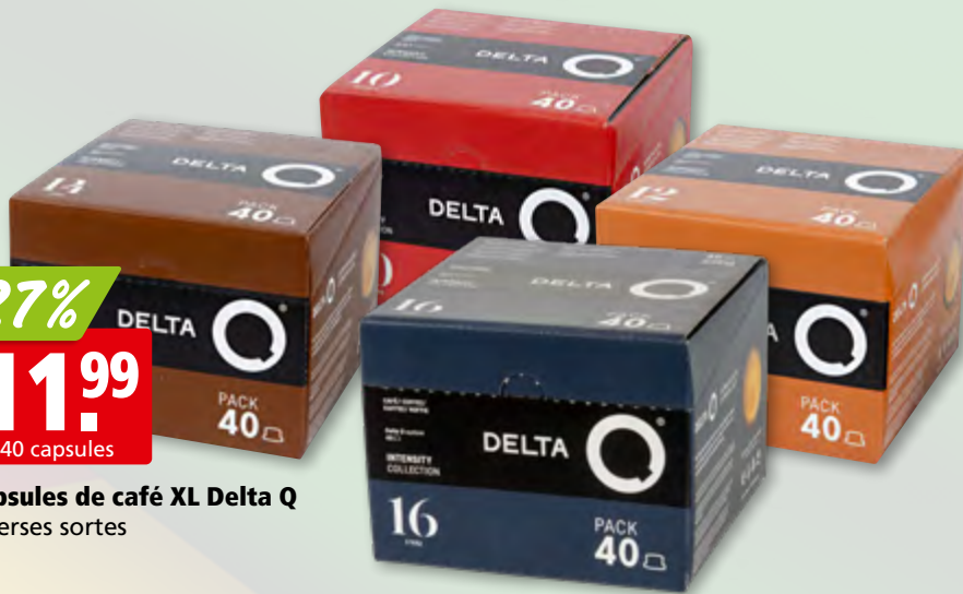
Capsules de café XL Delta Q diverses sortes