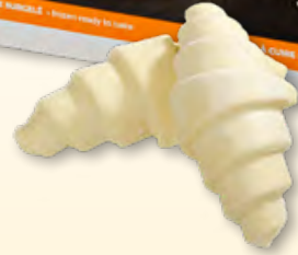
Croissant au beurre Bridor surg., 30 x