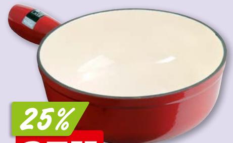
Réchaud à fondue Longfire Kisag