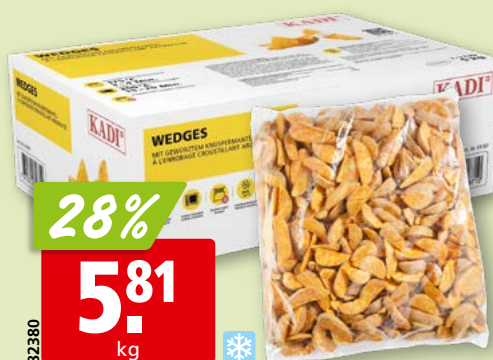
Wedges Kadi épiciées, surg., 2 x 2.5 kg