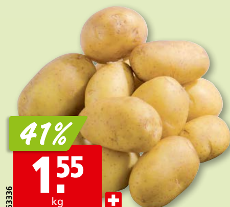
Pommes de terre nouvelles de Suisse, 10 kg (2.5 kg: 4.83 , 34%)