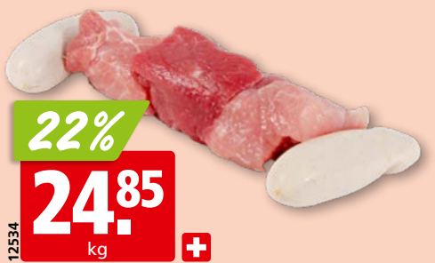
Viande hachée de bœuf frais, 8 mm de Suisse/Autriche