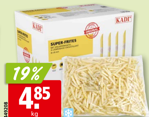
Super-frites Kadi surg., 4 x 2.5 kg