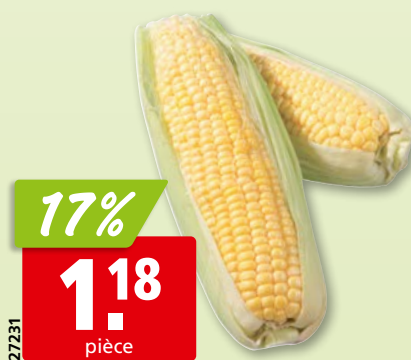
Maïs doux du Maroc, 14 x