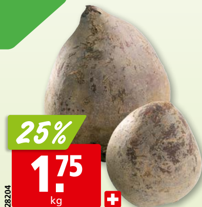
Betteraves crues de Suisse, env. 10 kg