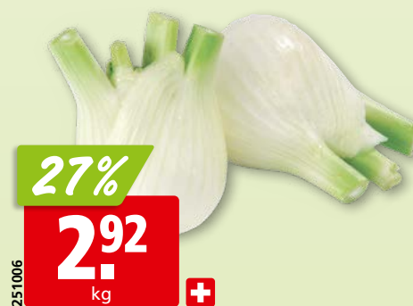
Fenouil de Suisse, env. 6 kg