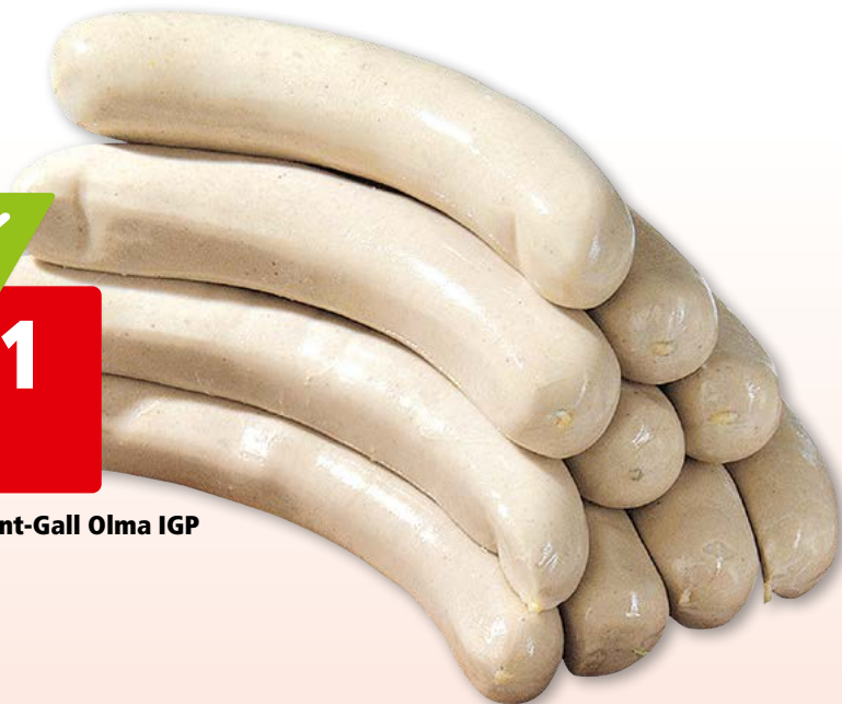
Saucisse de Saint-Gall Olma IGP 10 x