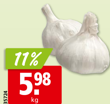
Ail sélection de Chine/Argentine, 5 kg (500 g: 3.85 , 22% | 240 g: 1.90 , 31%)