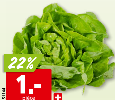
Salade pommée/cabus de Suisse, 8 x