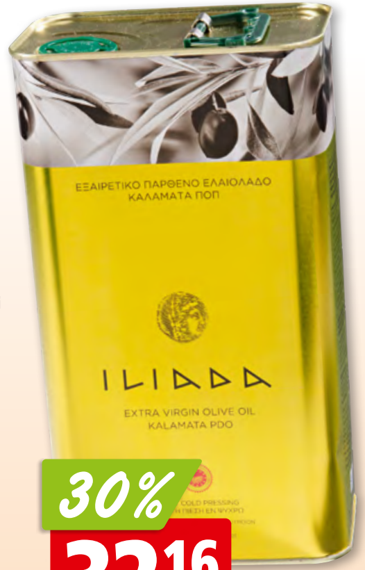
Iliada Olivenöl Extra Vergine Koroneiki 6 x