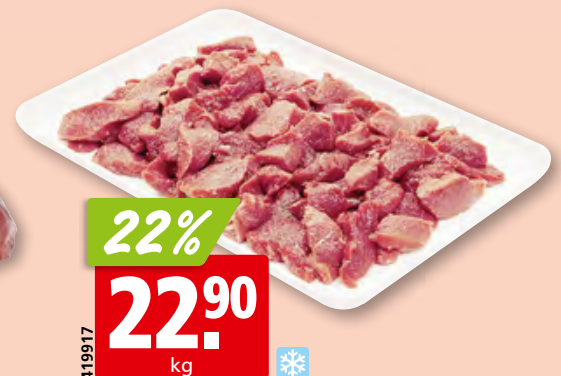
Lammschulter frisch aus der Schweiz/Neuseeland/Australien/ Irland