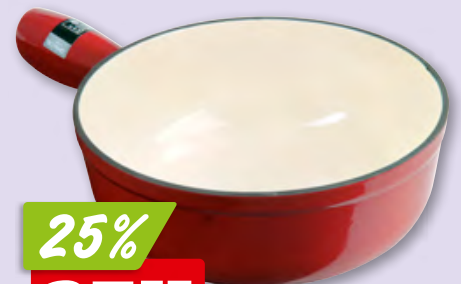
Kisag Fondue-Réchaud Longfire