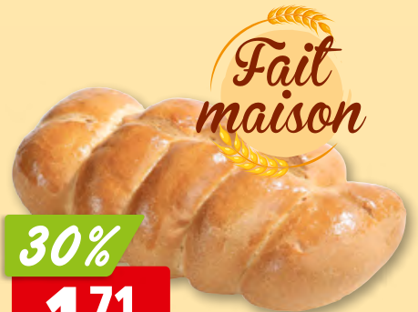
Pain tessinois de notre boulangerie artisanale