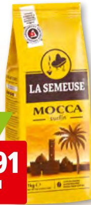
Café mocca surfin La Semeuse en grains, 10 x