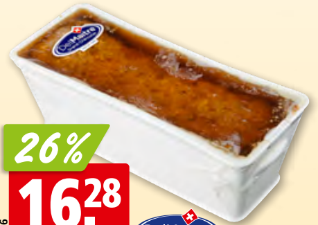
Terrine de campagne Del Maitre env. 1.4 kg