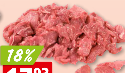
Aiguillette de rumsteak de bœuf frais de Suisse/Allemagne/Autriche (pluchée: 22.90/kg, 21%)