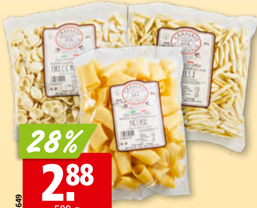
Pâtes Granaio Molisano paccheri, orecchiette ou fusilli