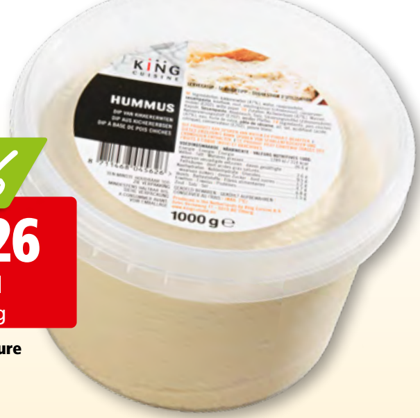
Houmous nature King Cuisine