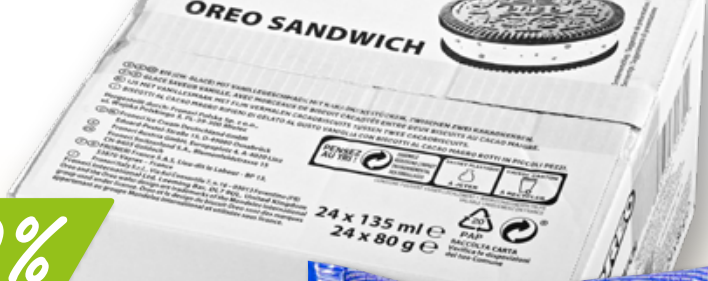
78583 Ice sandwich Oreo 24 x