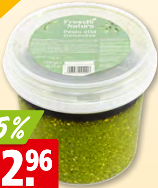
Pesto alla genovese Freschi di natura