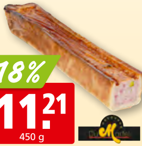
Pâté en croûte cocktail au porto Du Martel