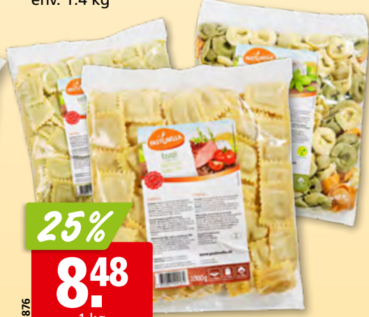
Pâtes farcies Pastinella diverses sortes