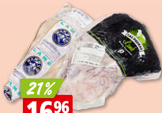
Jarrets d'agneau frais d'Australie/Nouvelle-Zélande/Irlande 2 pièces