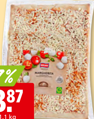
Pizza Margherita family Hilcona