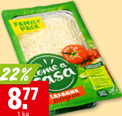
Lasagne bolognese Come a casa