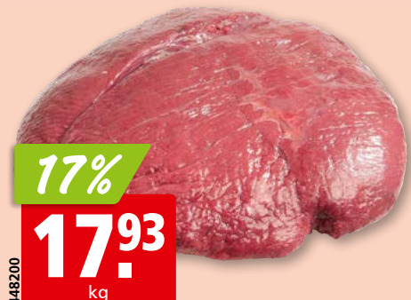
Faux-filet de cheval frais, original d'Argentine