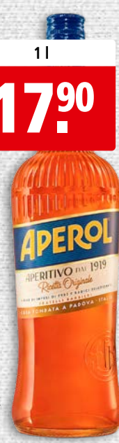
Aperol Bitter 11% vol.