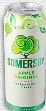
Somersby Apple Original