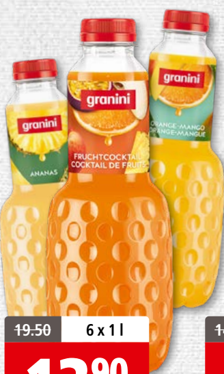
Granini cocktail de fruits, orange-mangue ou ananas