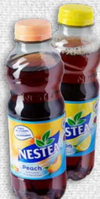
Nestea peach ou lemon