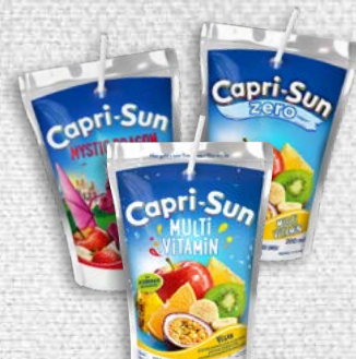
Capri-Sun diverses sortes

Plus avantageux par carton, nos vins se vendent aussi à l'unité. Offre spiritueux non soumise à la validité du prospectus.