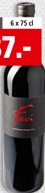
Assemblage de cépages nobles Favi Les Fils de Charles Favre Valais AOC 2023