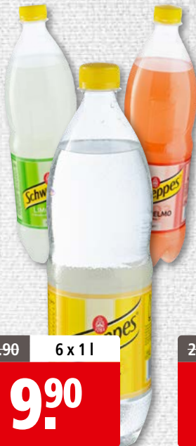
Schweppes diverses sortes