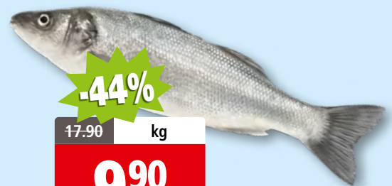
Turbot d'élevage vidé frais, 1-2 kg d'Espagne