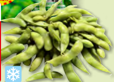
Edamame Nissui petits pois japonais cuits, surgelés