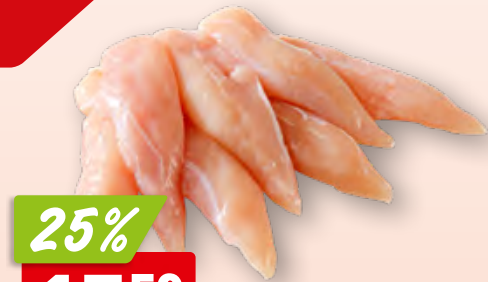
Pouletbrust frisch aus den Niederlanden/Deutschland, ca. 2.5 kg