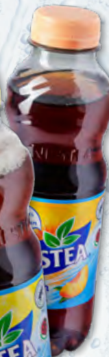
Nestea Lemon oder Peach 24 x