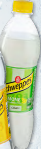
Schweppes Tonica oder Limone 12 x