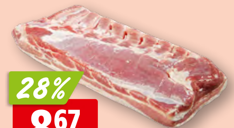
Del Maitre Bratspeck geräuchert, geschnitten, ca. 1 kg