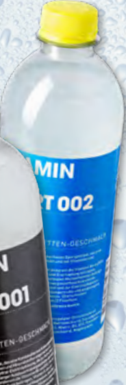
Vitamin Well Sport Isotonic oder Low Calorie 12 x