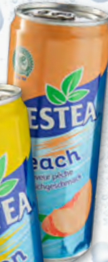
Nestea Lemon oder Peach 24 x