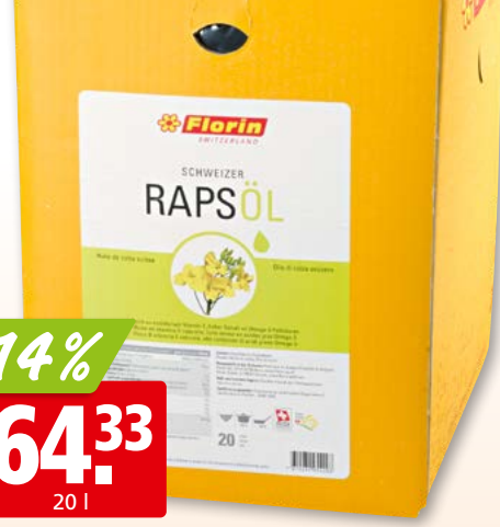
Huile de colza suisse Florin