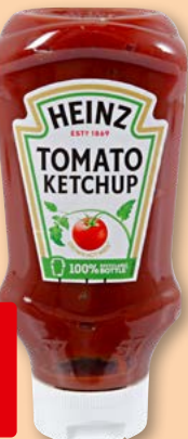
Tomato Ketchup Heinz