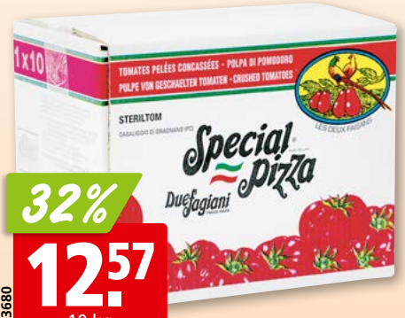
Tomates Due Fagiani concassées