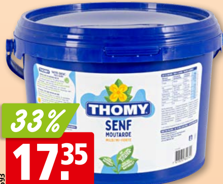
Moutarde Thomy mi-forte