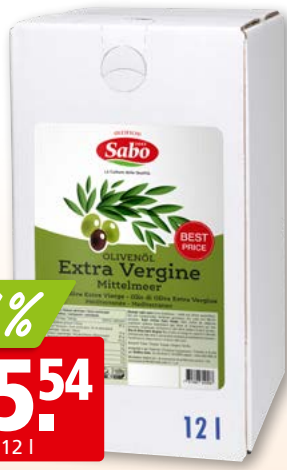
Huile d'olive extra vierge Méditerranée Sabo