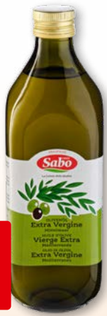
Huile d'olive extra vierge Méditerranée Sabo