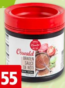
Sauce de rôti spécial