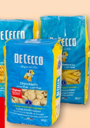
Pâtes De Cecco linguine n° 7, spaghetti n° 12, fusili n° 34, penne rigate n° 41 ou orecchiette, 6 x