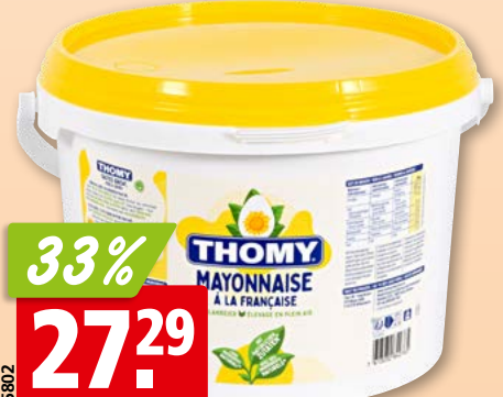
Mayonnaise à la Française Thomy