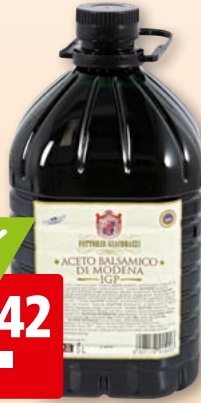
Aceto balsamico di modena IGP Giacobazzi