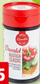
Mélange de viande rustica