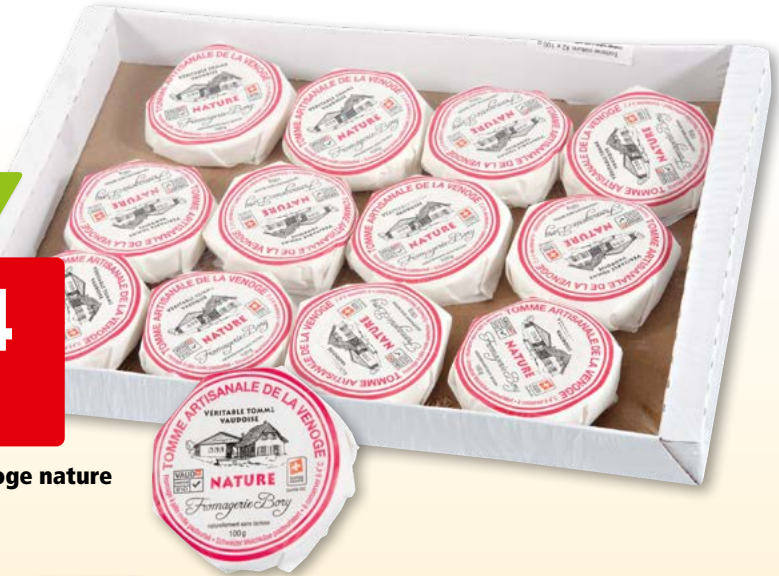
Tomme de la Venoge nature 12 x