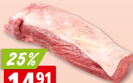
Rindshuft Gastro frisch pariert aus der Schweiz/Deutschland/Österreich