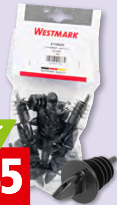
Westmark Ausgiesser Jet-Pour schwarz, 12 x