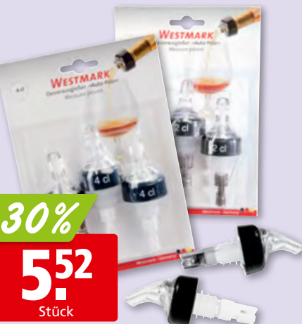
Westmark Dosierausgiesser Posi-Pour 4 cl oder 2 cl, 3 x