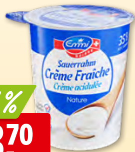
Emmi Sauerrahm 35% Fett