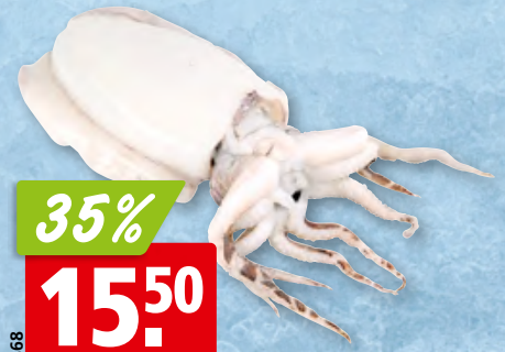
Kalmarringe aufgetaut, aus dem Südostpazifik/ Mittelmeer/Schwarzen Meer