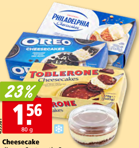
Cheesecake diverse Sorten, tk, 2 x