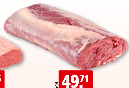
Entrecôte aus Irland