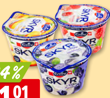
Emmi Skyr by YoQua diverse Sorten, 6 x