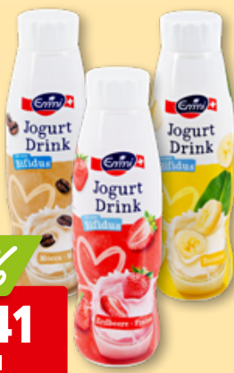
Emmi Bifidus Joghurt Drink diverse Sorten, 3 x