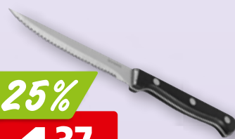
Steakmesser Grill Party 6 x