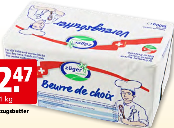
Züger Vorzugsbutter 10 x