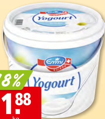
Emmi Joghurt nature 3 kg