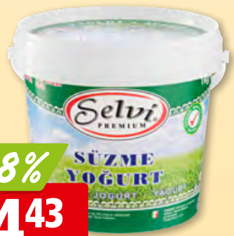
Züger Joghurt Selvi