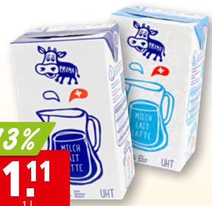
Prima Milch UHT voll 3.5% Fett oder Drink 1.5% Fett, 12 x