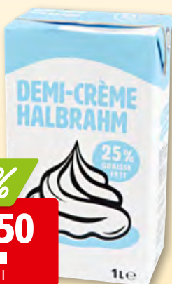
Halbrahm UHT 25% Fett, 12 x