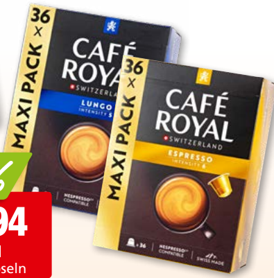
Café Royal Kaffeekapseln Espresso oder Lungo