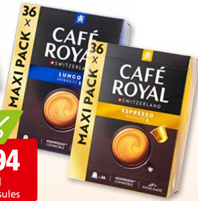
Capsules de café Café Royal espresso ou lungo