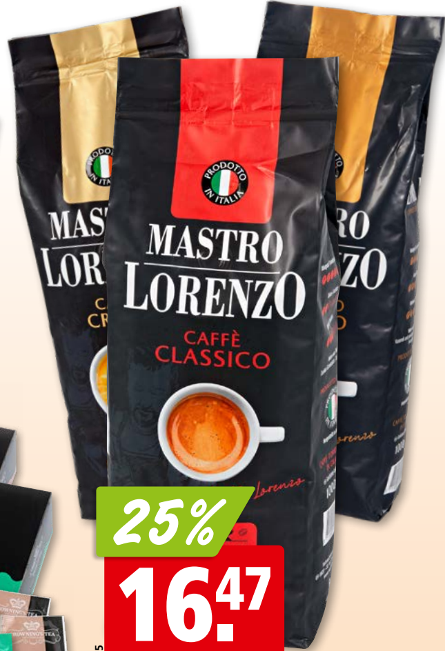
Café Mastro Lorenzo en grains, classico, crema ou intenso