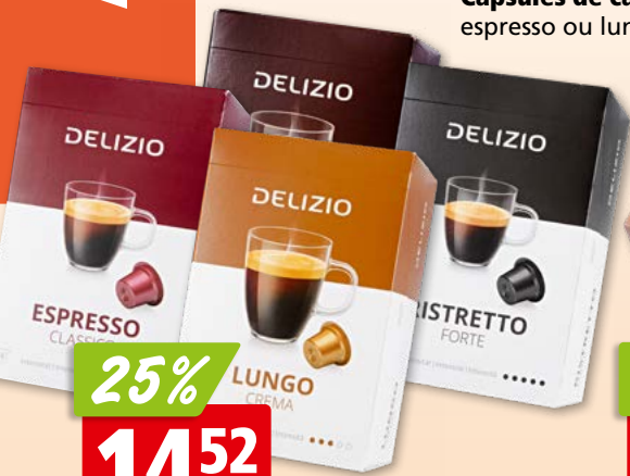
Capsules de café Delizio diverses sortes