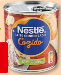
Lait condensé Nestlé cuit