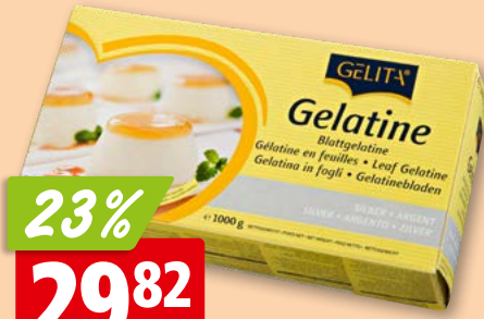
Gélatine Gelita en feuilles, argent