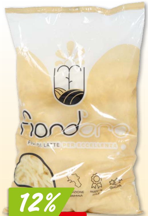
Mozzarella di bufala Züger