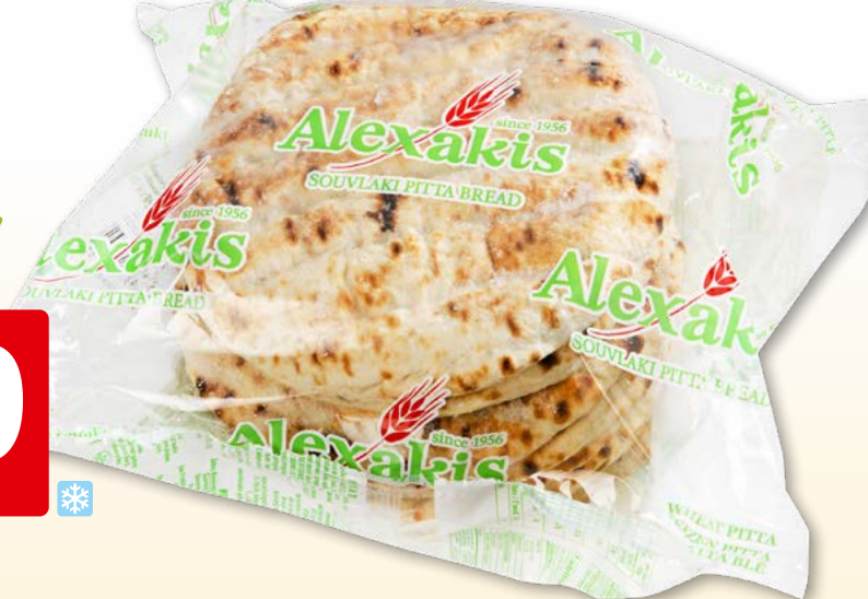
Pain pita Alexakis surg., 10 x