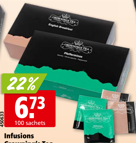
Infusions Crowning's Tea menthe ou english breakfast