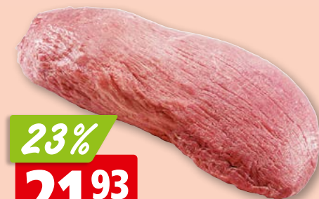
Palette de bœuf frais de Suisse/Allemagne/Autriche