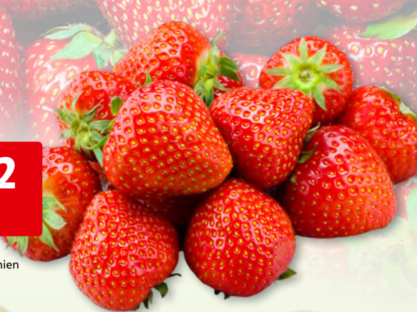
Erdbeeren sortiert, aus Spanien