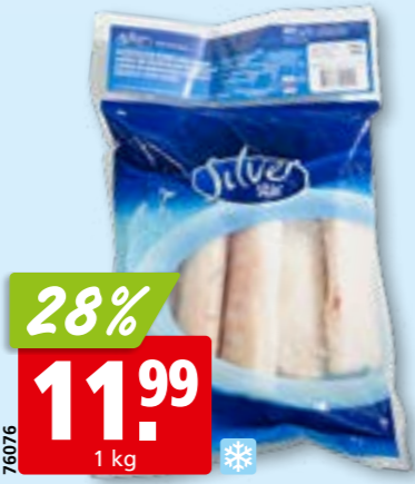
Silver Star Kabeljau-Loins, 140-160 g MSC, aus dem Pazifik, tk