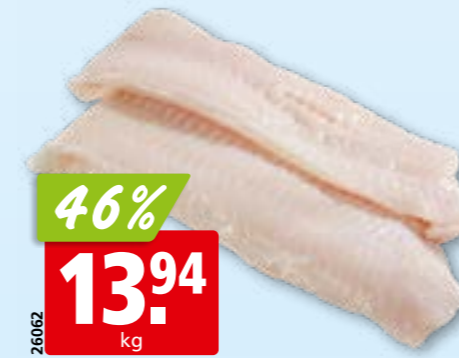
Steinbeisserfilets frisch aus dem Nordostatlantik