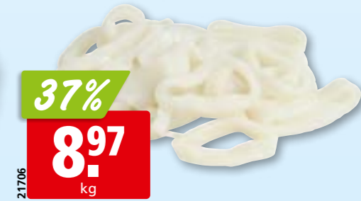
Kalmarringe aufgetaut, aus dem Südostpazifik