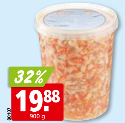
Flusskrebsschwänze in Lake