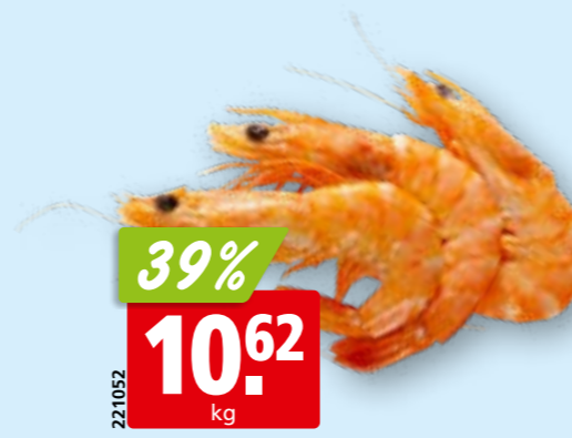
Krevetten, 60-80 gekocht, gekühlt aus Ecuador/Venezuela