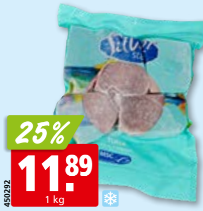
Silver Star Thunfischsteaks, 150-200 g MSC, tk