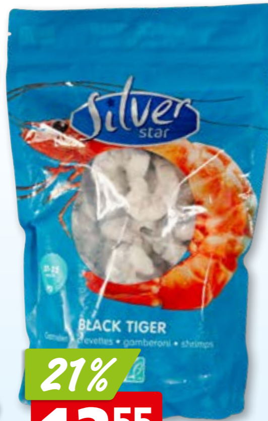
Silver Star Krevettenschwänze Black Tiger, 21-25 ASC, geschält, tk, 10 x