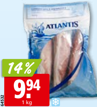
Atlantis Kalmare ganz, ungeputzt, tk, 10 x