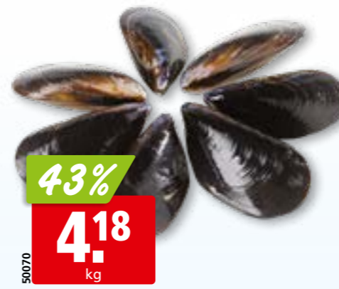
Miesmuscheln küchenfertig, aus Spanien, 1,4 kg