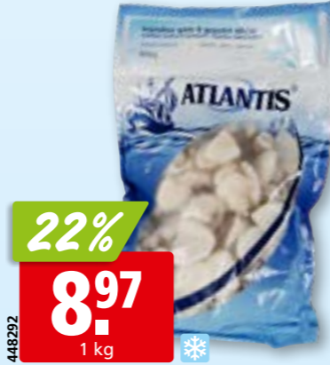
Kleine Tintenfische, 60-80 ganz, tk