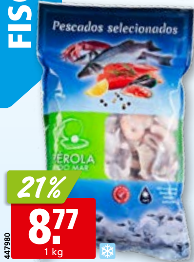
Meeresfrüchte Cocktail aus Vietnam, tk

Anlieferung frischer Fisch ab Dienstag Mittag.