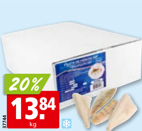
Eglifilets, 10-20 g IQF, mit Haut, tk, 5 kg