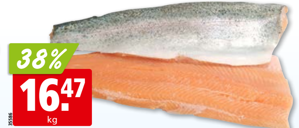
Rote Forellenfilets frisch mit Haut, aus Frankreich