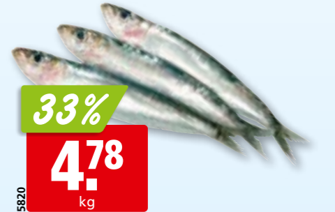
Sardinen frisch aus dem Mittelmeer