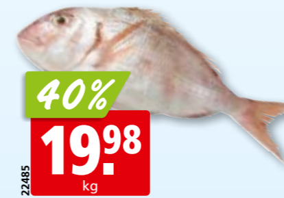
Sackbrasse frisch, 400-600 g aus dem Mittleren Ostatlantik