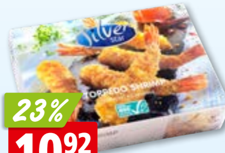
Silver Star Torpedo Krevetten paniert, ASC, tk