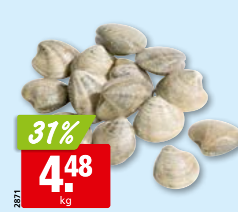
Vongole frisch aus Italien