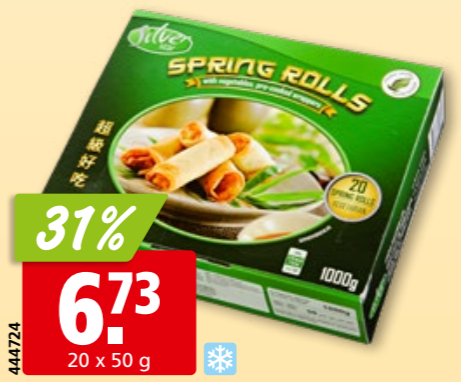
Silver Star Frühlingsrollen mit Gemüse tk