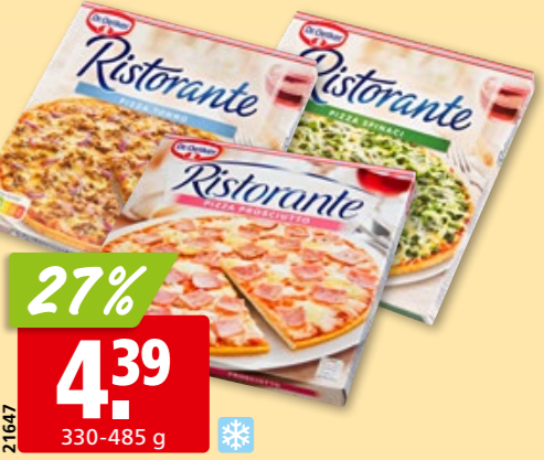
Dr. Oetker Pizza Ristorante diverse Sorten, tk