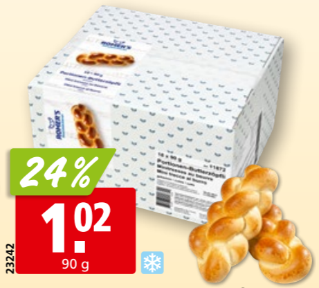
Romer's Portionen-Butterzöpfli tk, 18 x