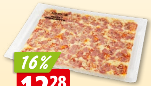
Pizza mit Schinken 40 x 30 cm