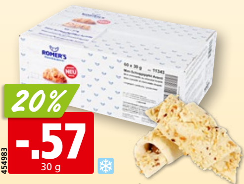
Avanti Mini-Schoggigipfeli tk, 60 x

20% auf gefüllte frische Pasta PASTIFICIO RIVETTI