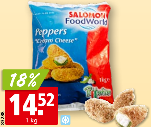
Salomon FoodWorld Jalapeños Peppers Cream Cheese 26-33 Stück, tk