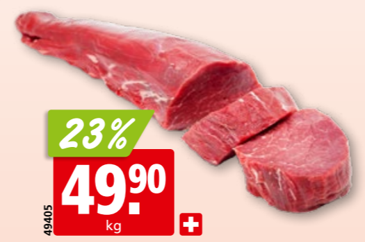
Rindsfilet frisch aus der Schweiz