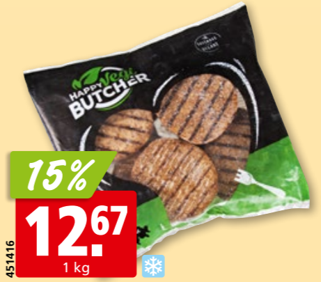
Happy Vegi Butcher Vegan Burgers tk