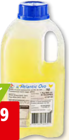
Eiweiss flüssig Bodenhaltung, importiert