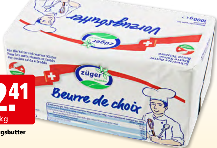
Züger Vorzugsbutter 10 x