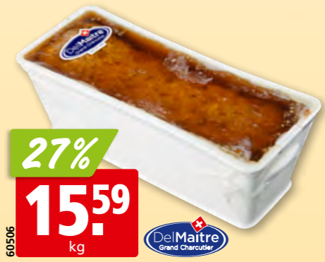
Del Maître Bauern-Terrine ca. 1.4 kg