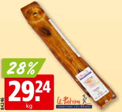
Le Patron Kalbfleischpastete Apero ca. 500 g