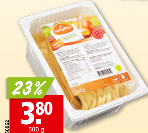
Pastinella Tagliatelle, 6 mm