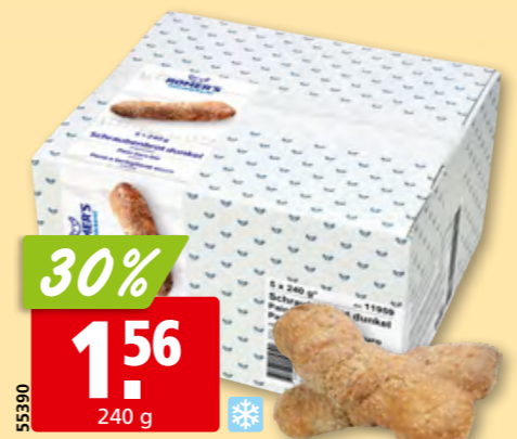
Romer's Schraubenbrot dunkel tk, 5 x