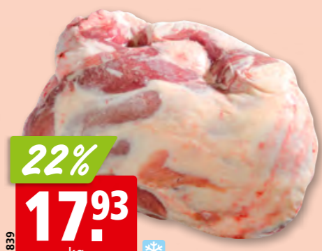
17839 22% 17.93 kg Lammschulter ohne Bein, aus Australien/Neuseeland/ Irland, tk