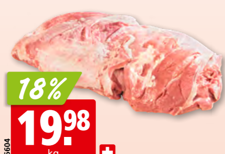
76604 18% 19.98 kg + Kalbshals frisch dressiert, ohne Knochen aus der Schweiz, ca. 3 kg