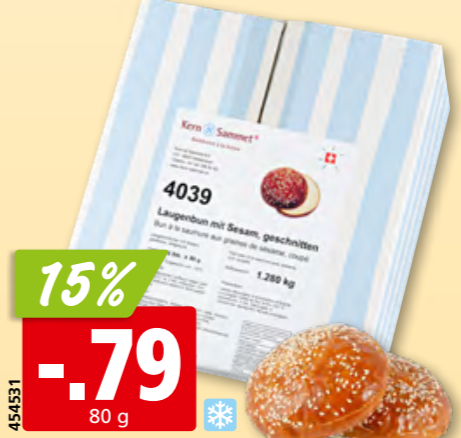
Kern & Sammet Laugenbun mit Sesam geschnitten, tk, 16 x