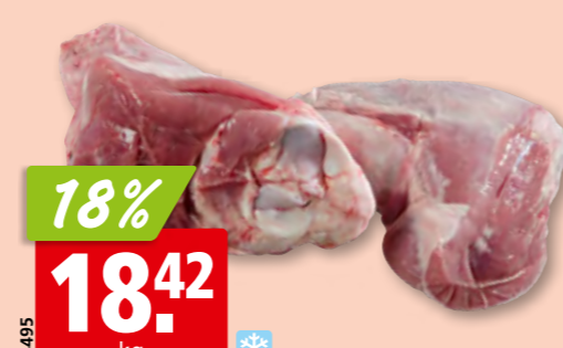
34495 18% 18.42 kg Lammhaxen aus Neuseeland/Australien/Irland, tk