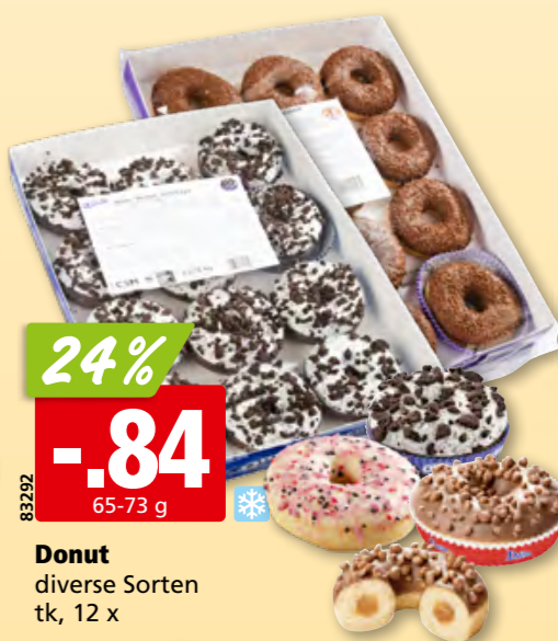
Donut diverse Sorten tk, 12 x