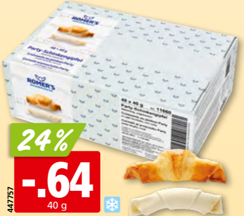
Romer's Schinkengipfel Party tk, 48 x