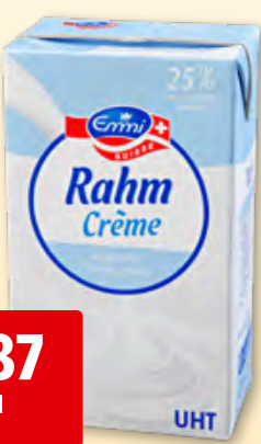
Emmi Halbrahm UHT 25% Fett, 12 x