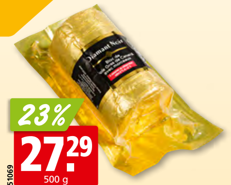
Diamant Noir Enten-Foie gras mit 30% Stücken