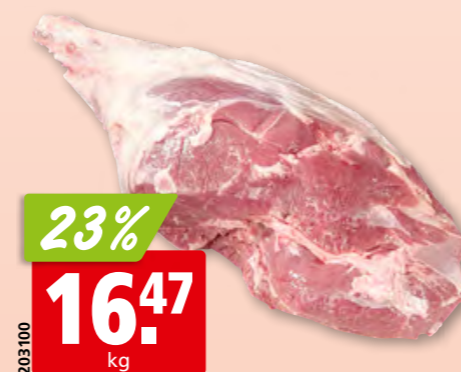
203100 23% 16.47 kg Lamm-Gigot frisch mit Bein, aus Australien/Neuseeland/ Irland, ca. 2.5 kg ( ohne Bein, gerollt: 20.96/kg, 20%)