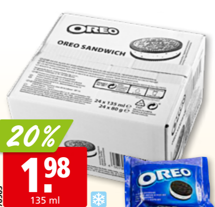
Oreo Ice Sandwich 24 x

IN AKTION alle Rahmgelaten und Sorbets 3.8 l FRISCO CLASSIC