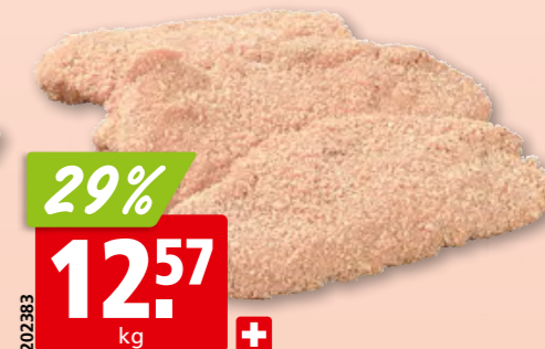
202383 29% 12.57 kg + Schweinsschnitzel frisch paniert, aus der Schweiz, 8 Stück