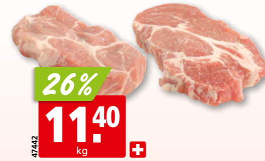
47442 26% 11.40 kg + Schweins-Halsschnitzel frisch aus der Schweiz, 20 Stück (mariniert, 10 x: 12.57/kg, 14%)