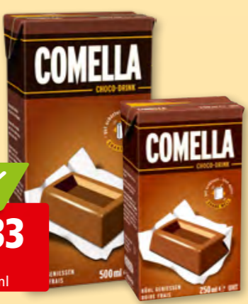
Comella Choco-Drink 12 x (-.73/250 ml, 20%, 18 x)