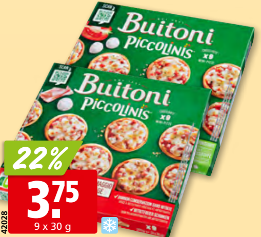
Buitoni Piccolinis Prosciutto & Formaggio oder Pomodoro/Mozzarella, tk