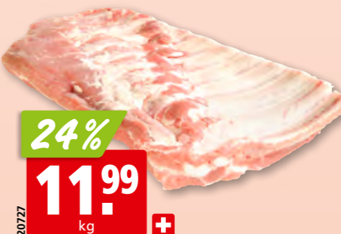
20727 24% 11.99 kg + Schweins-Brustplatten frisch aus der Schweiz