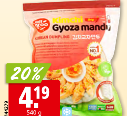
All Groo Gyoza koreanisch Kimchi tk