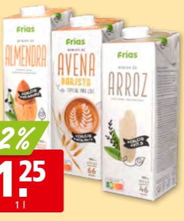
Frias Pflanzendrink diverse Sorten, 6 x