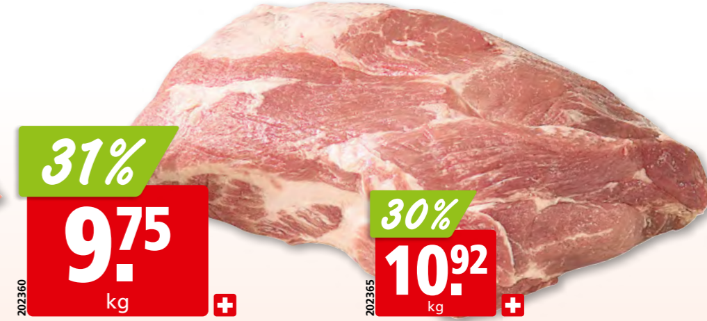
202360 31% 9.75 kg + Schweinhals frisch aus der Schweiz, ca. 2 kg