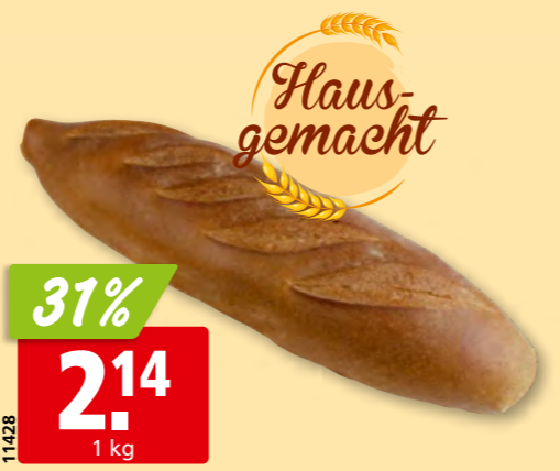
Ruchbrot aus unserer Hausbäckerei