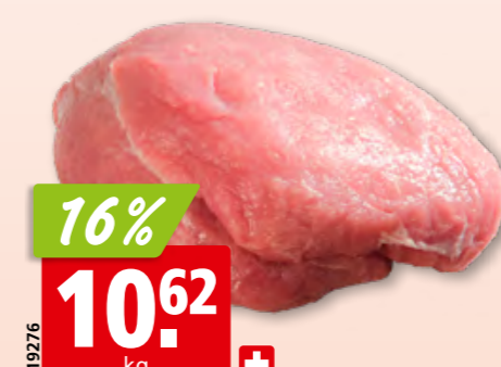
419276 16% 10.62 kg + Schweinsnuss frisch aus der Schweiz