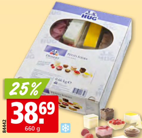
Hug Petits Fours süß 2 x 24 Stück, tk