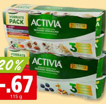
Danone Activia Frucht-Mix oder Cerealien-Mix, 8 x