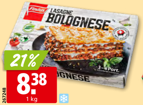
Findus Lasagne alla Bolognese tk