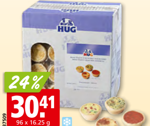
Hug mini Party-Chüechli 4 Sorten, tk