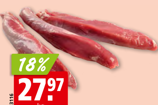
203116 18% 27.97 kg Lammfilets frisch aus Australien/Neuseeland