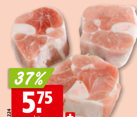
15224 37% 5.75 kg + Schweins-Osso Buco aus der Schweiz, aufgetaut