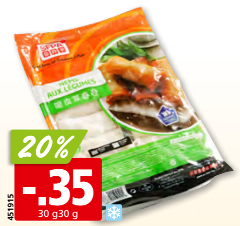
SFPA Gemüse-Nem tk, 48 x