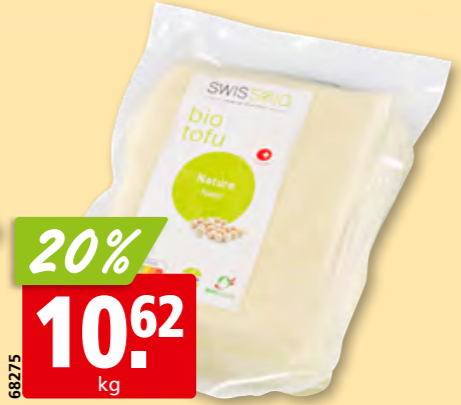
Natur-Tofu Bio, ca. 1 kg