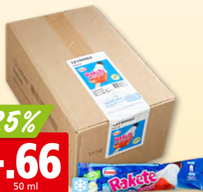
Nestlé Frisco Rakete 42 x