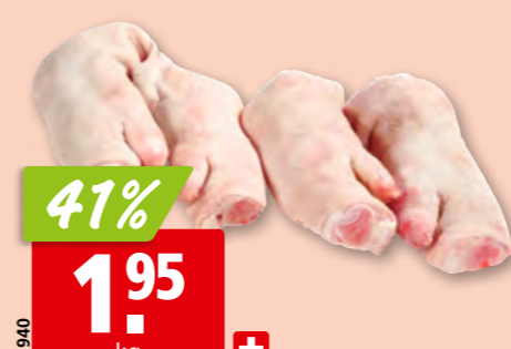
43940 41% 1.95 kg + Schweinsfüsse frisch geschnitten, aus der Schweiz, 10 Stück