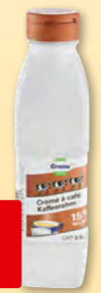
Cremo Kafferahm UHT 15% Fett