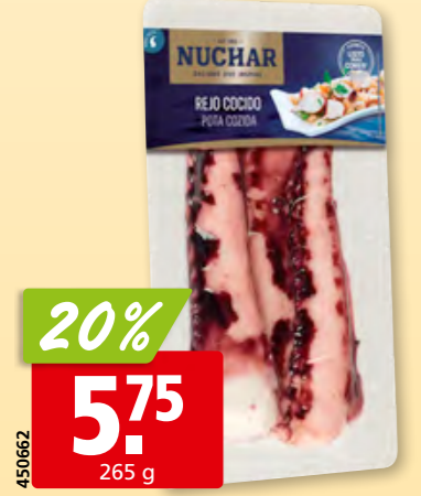
Nuchar Riesenkalmar-Tentakeln gekocht