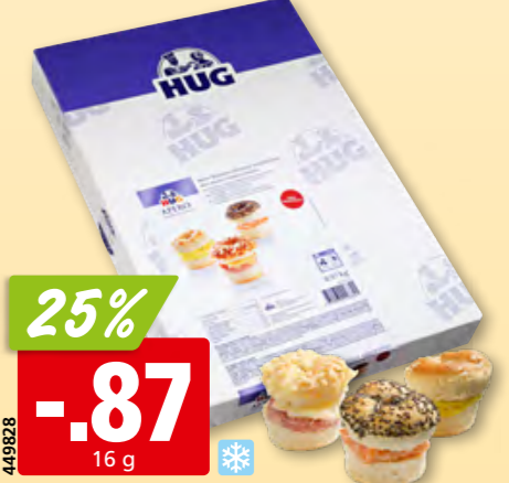
Hug Mini Bagel gefüllt 3 Sorten, tk, 60 x