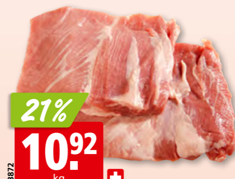
83872 21% 10.92 kg + Schweins-Secreto frisch aus der Schweiz