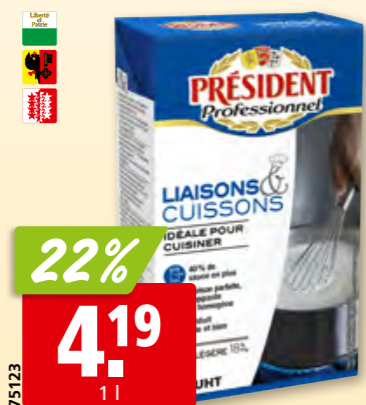
Président Saucen- & Kochrahm 18% Fett, 6 x