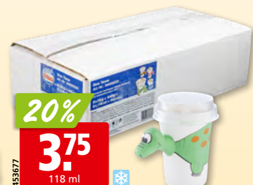
Frisco Dino Tasse 8 x