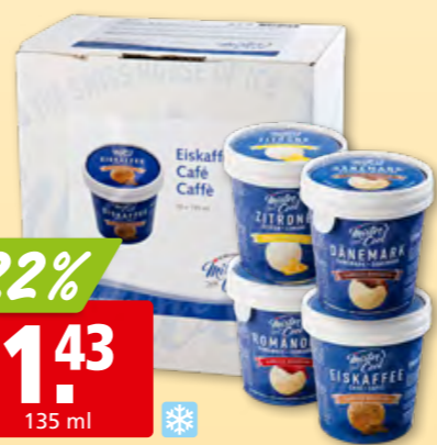
Mister Cool Eisbecher diverse Sorten, 18 x