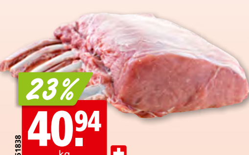
451838 23% 40.94 kg + Kalbs-Racks frisch aus der Schweiz