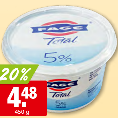
Fage griechisches Joghurt nature Total 5% Fett