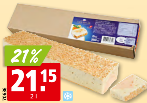
Nestlé Frisco Imperial Bûche Nougat/Aprikose