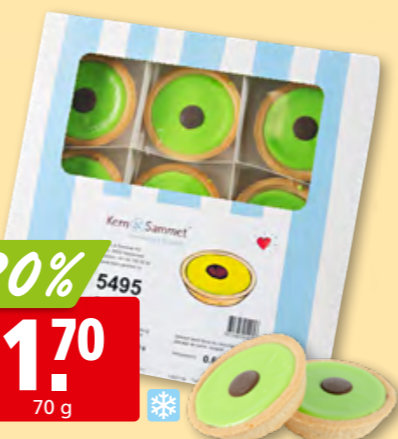
Kern & Sammet Carac tk, 9 x