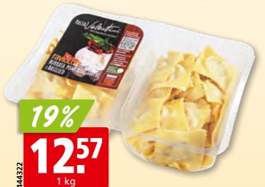
Valentini Ravioli Burrata/getrocknete Tomaten/Basilikum