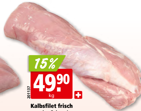
201137 15% 49.90 kg + Kalbsfilet frisch aus der Schweiz