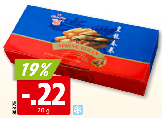
Le Dragon Frühlingsrolle mit Geflügel tk, 96 x