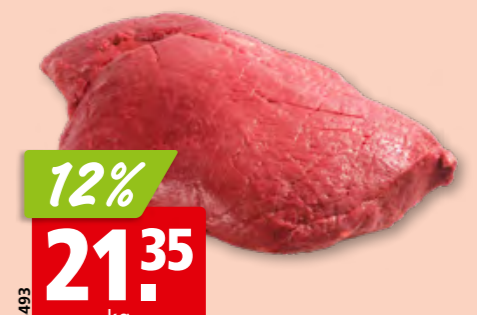
78493 12% 21.35 kg Pferde-Steak Stück frisch aus Argentinien