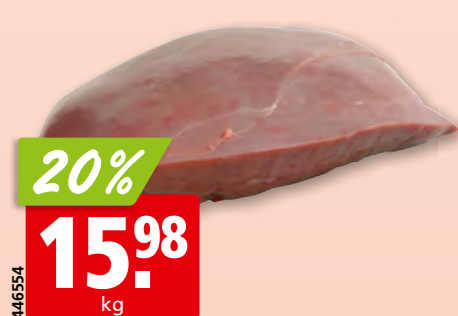
446554 20% 15.98 kg Kalbsleber frisch aus der Europäischen Union, 1/2