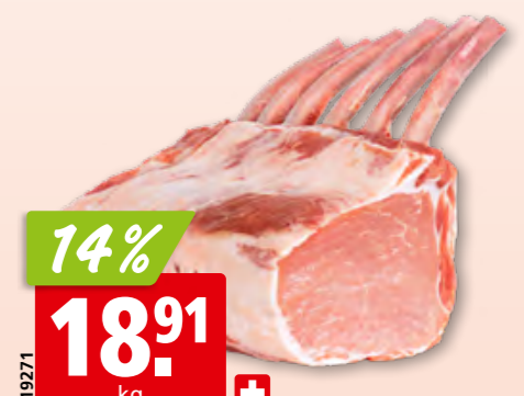
419271 14% 18.91 kg + Schweins-Racks frisch aus der Schweiz, 6 Rippen