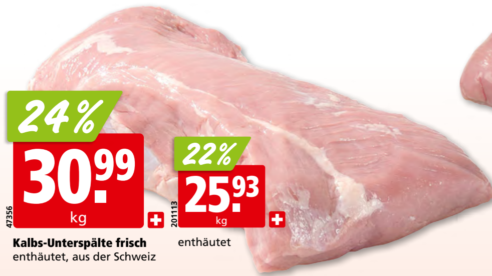
47356 24% 30.99 kg + Kalbs-Unterspälte frisch enthäutet, aus der Schweiz