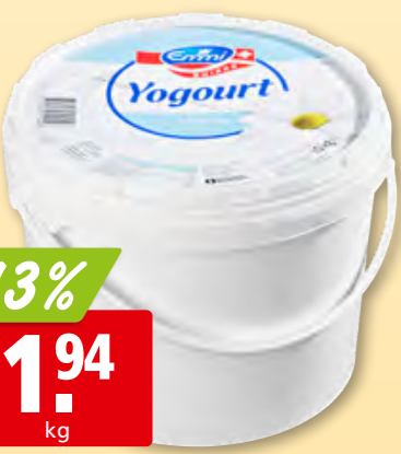
Emmi Joghurt nature 10 kg