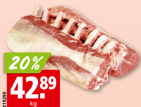
419299 20% 42.89 kg Lamm-Racks Ambassador frisch aus Australien