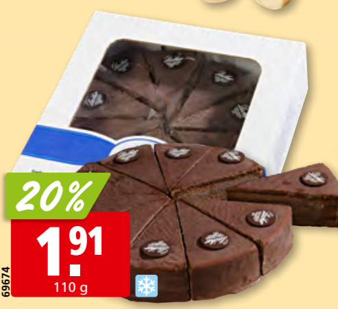
Romer's Sachertorte tk, 10 x