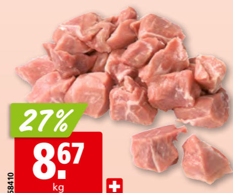
58410 27% 8.67 kg + Schweins-Voressen frisch aus der Schweiz, ca. 3 kg