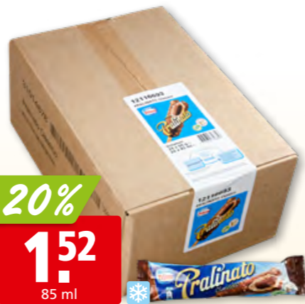
Nestlé Frisco Pralinato Classico 24 x