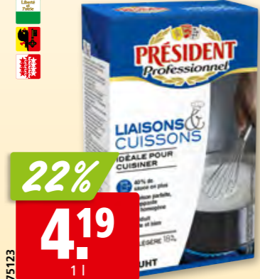
Président Saucen- & Kochrahm 18% Fett, 6 x