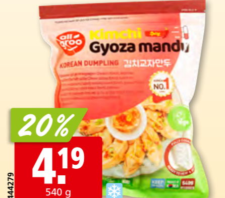
All Groo Gyoza koreanisch Kimchi tk