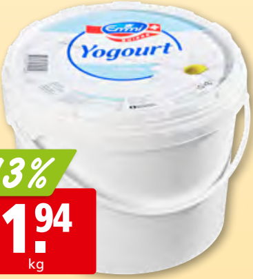
Emmi Joghurt nature 10 kg