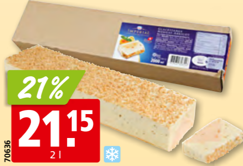
Nestlé Frisco Imperial Bûche Nougat/Aprikose