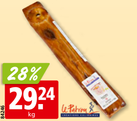
Le Patron Kalbfleischpastete Apero ca. 500 g