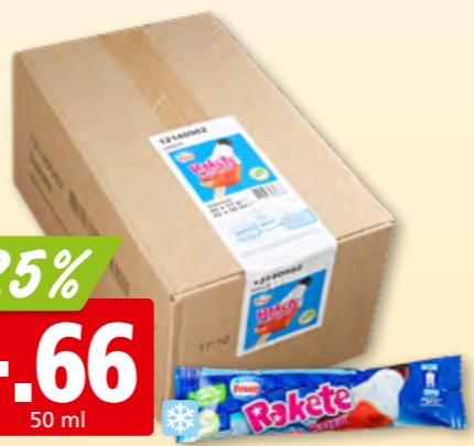
Nestlé Frisco Rakete 42 x