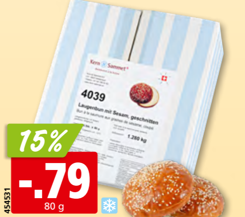
Kern & Sammet Laugenbun mit Sesam geschnitten, tk, 16 x