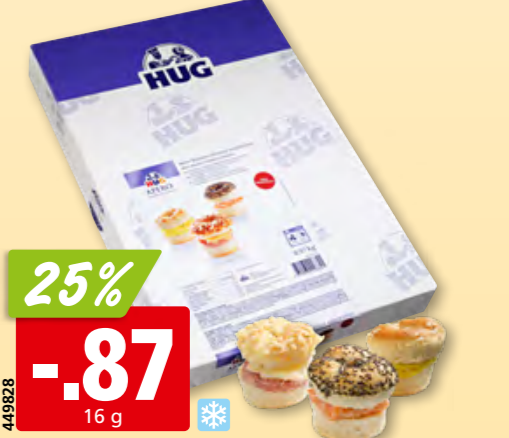
Hug Mini Bagel gefüllt 3 Sorten, tk, 60 x