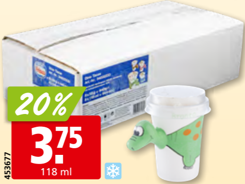
Frisco Dino Tasse 8 x