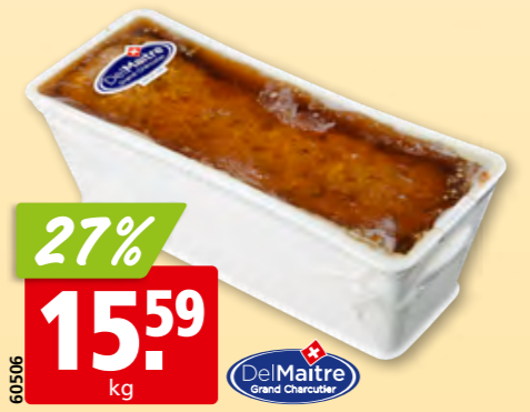
Del Maître Bauern-Terrine ca. 1.4 kg