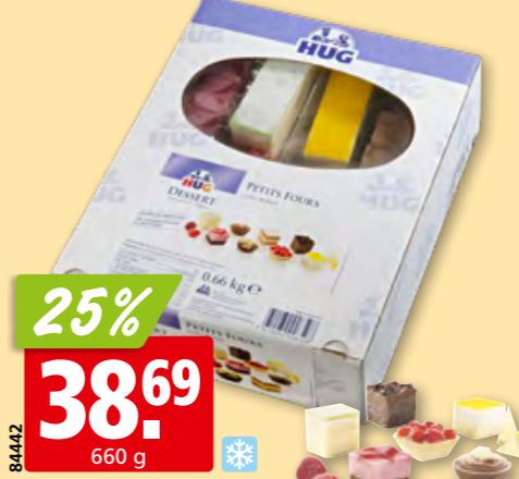
Hug Petits Fours süß 2 x 24 Stück, tk