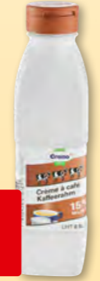
Cremo Kafferahm UHT 15% Fett