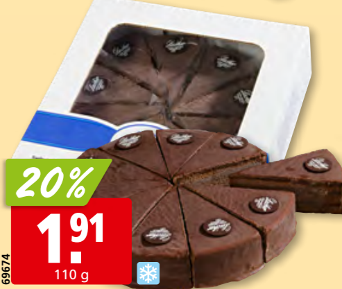
Romer's Sachertorte tk, 10 x