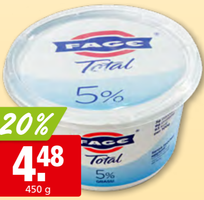
Fage griechisches Joghurt nature Total 5% Fett