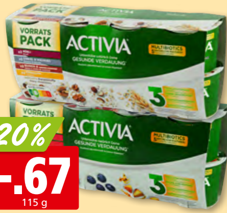
Danone Activia Frucht-Mix oder Cerealien-Mix, 8 x