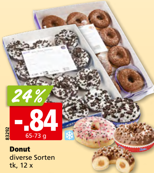
Donut diverse Sorten tk, 12 x