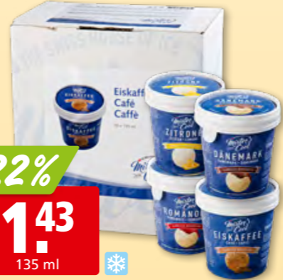
Mister Cool Eisbecher diverse Sorten, 18 x