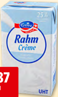
Emmi Halbrahm UHT 25% Fett, 12 x