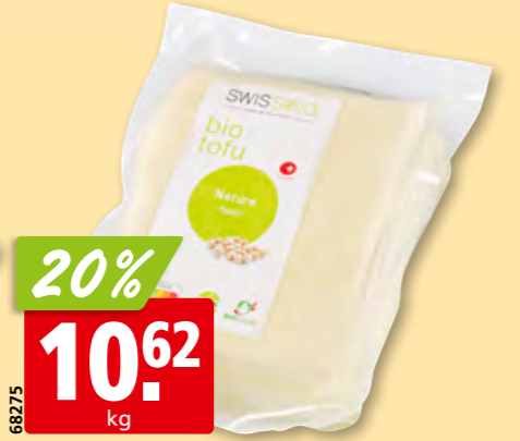
Natur-Tofu Bio, ca. 1 kg