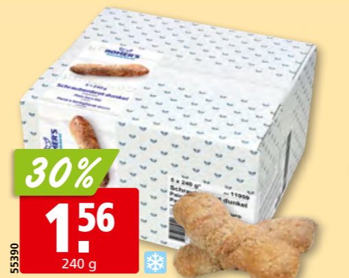
Romer's Schraubenbrot dunkel tk, 5 x