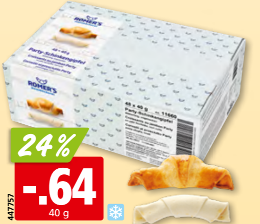
Romer's Schinkengipfel Party tk, 48 x